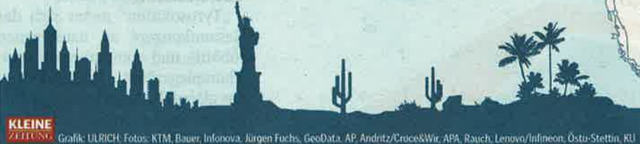
KLEINE ZEITUNG Grafik: ULRICH

Von Brasilien bis Japan, von Australien bis Nigeria, von Cambridge bis China: Ob Grazer Bildsensor-Chips für die weltkleinsten 3D-Kameras, Leobener Datenmanagement für die neue Londoner Kanalisation, Liezener Präzisionsteile für den neuen ICE der Deutschen Bahn oder spektakuläre Holzkonstruktionen aus der Obersteiermark für ein Pariser Museum: wo Steirer mit ihren Innovationen überzeugen können.